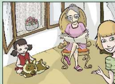
APPLICA LE ZANZARIERE ALLE FINESTRE!