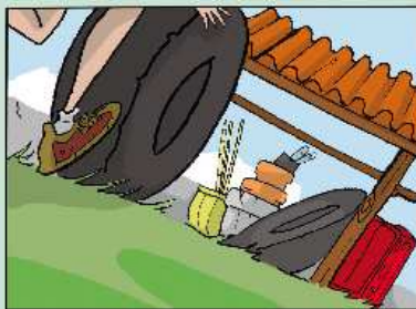
METTI AL RIPARO DI UNA TETTOIA QUELLO CHE PUÒ RACCOLGERE ACQUA.