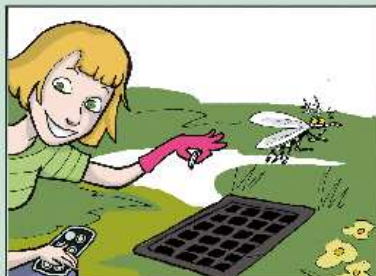
TRATTA PERIODICAMENTE I TOMBINI CON L'INSETTICIDA.