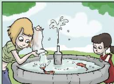
INTRODUCI NELLE FONTANE E NELLE VASCHE DEI PESCI.