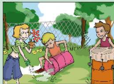
SVUOTA OGNI SETTIMANA ANCHE I SOTTOVASI E COPRI I BIDONI.